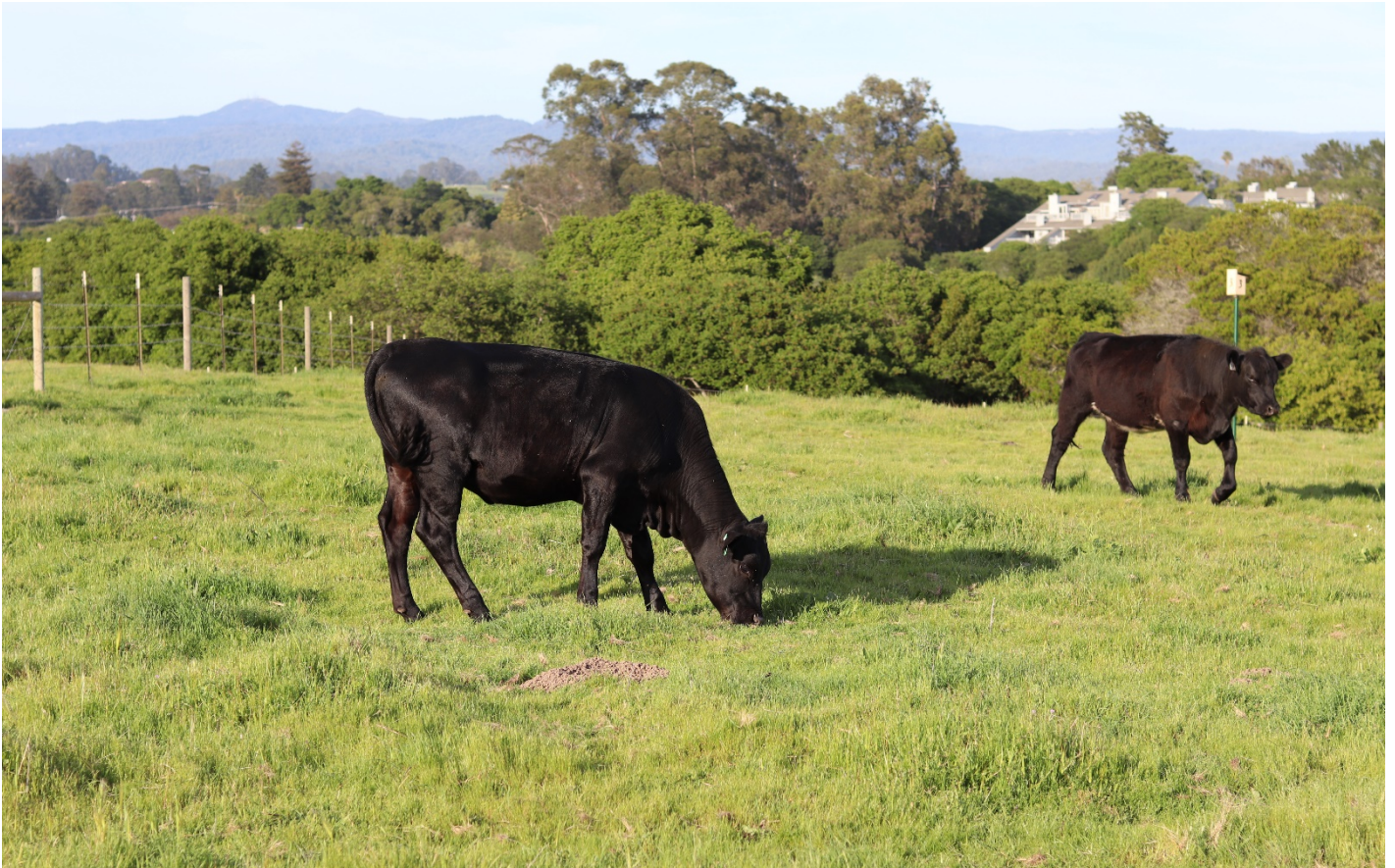
Imagen T. Sullivan